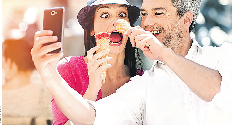
Периодически веселиться и валять дурака - тоже один из рецептов счастья.

Будем называть это сложно выразимое одним словом сочетание факторов «гормонами счастья». И как