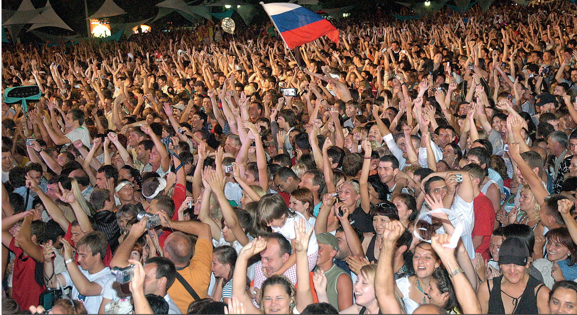
Тысячи людей собрались на Театральной площади курорта, чтобы отметить одно из важных событий - в Сочи пройдет Олимпиада!

- А мы из Ростова-на-Дону! Донской край болеет за Сочи!