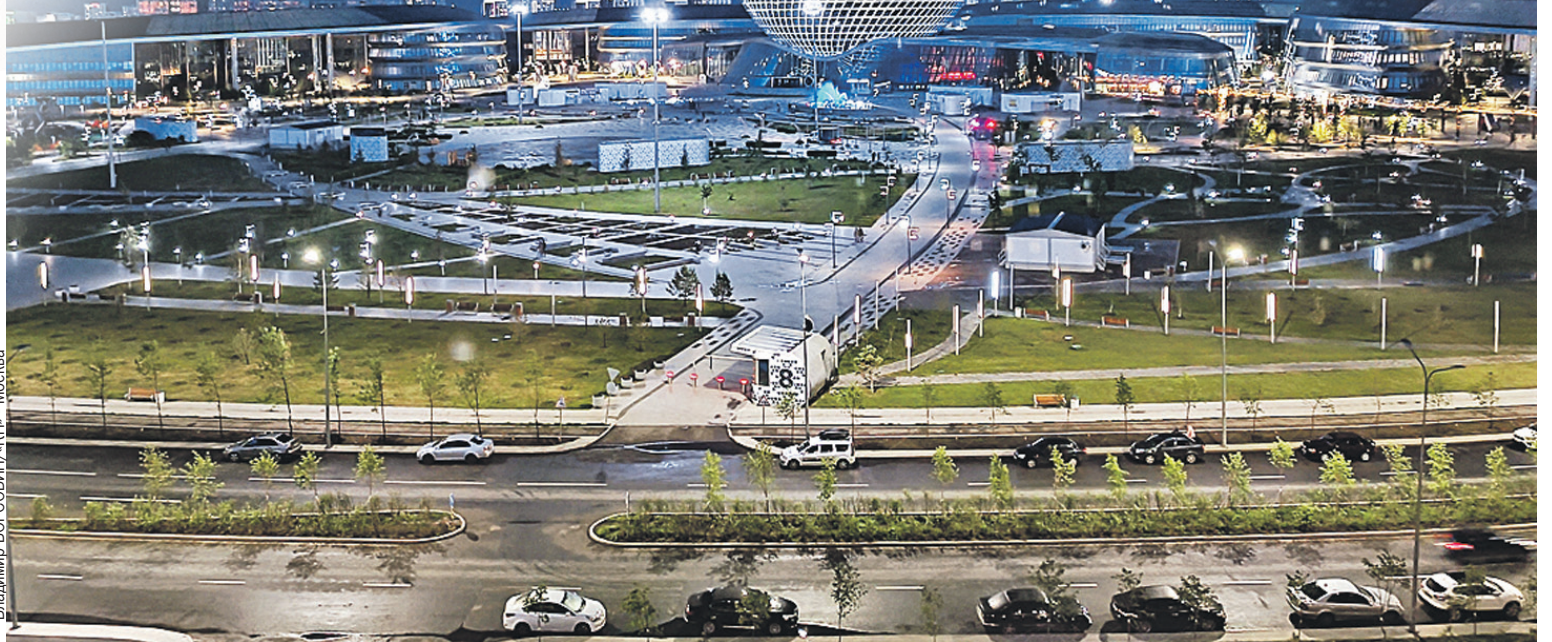
Нур-Султан (бывшая Астана, Акмолинск, Целиноград) сияет, как и положено новой столице.

- Не зря? - Испугалась власть, реформы затеяла. Каждый день какого-то чиновника аресто-