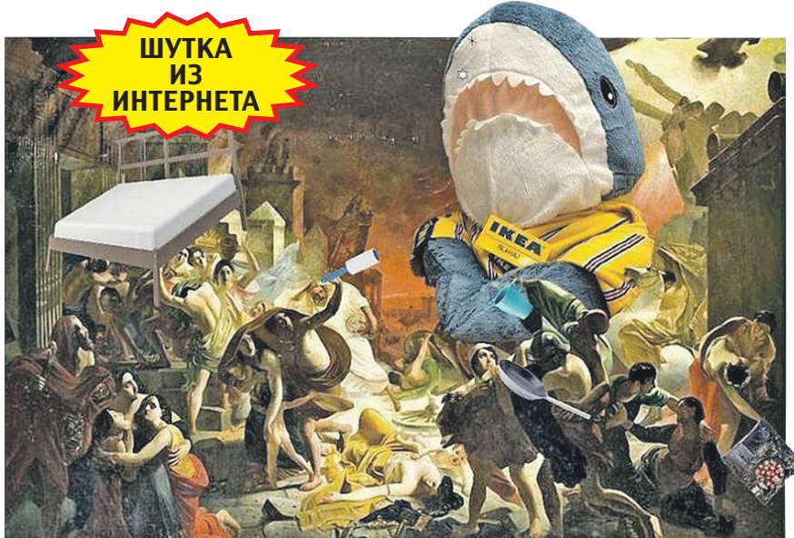
В сети уже появились шуточные картинки по мотивам знаменитого полотна русского художника Карла Брюллова.

родах, где есть магазины ИКЕА: Москва, Санкт-Петербург, Краснодар, Екатеринбург, Казань, Нижний Новгород, Новосибирск, Омск, Ростов-на-Дону, Самара и Уфа. Также доставку можно заказать в населенные пункты, расположенные на расстоянии не более 50 км от этих городов. Подробности уточняйте на сайте.