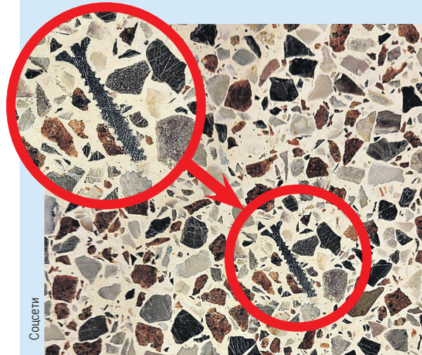
Шуруп в гранитной столешнице. То ли привет от другой цивилизации, то ли корявые руки производителей.

Мы не знаем, откуда этот шуруп взялся в граните. Версии разные. Тут и «временная петля». И древняя цивилизация, якобы существовавшая еще до появления людей. Но скептиков настораживает поверхность столешницы. А не гранитная ли это крошка, которую склеили раствором да и уронили шурупик-то? Наверняка так и есть. Это не отменяет того, что загадки в мире еще имеются. Просто, чтобы найти что-то новое, надо сохранять критичность мышления.