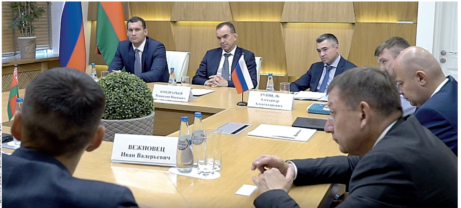
Вениамин Кондратьев отметил важность подписания соглашения с Минским тракторным заводом для экономики Кубани.

- Со своей стороны, мы должны создать все условия, чтобы в крае был выбор конкурентоспособных машин. Более полувека Минский тракторный завод поставляет