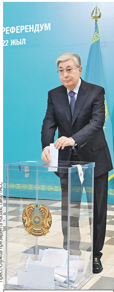
Президент Казахстана Токаев на референдуме по внесению изменений в конституцию страны.