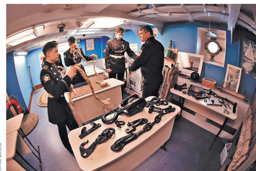
Занятия в Ботманском клубе на крейсере «Аврора». Через этот клуб прошли пятнадцать тысяч ребят и 23 девушки. 65 из них стали адмиралами. Адмиральшя пока нет.