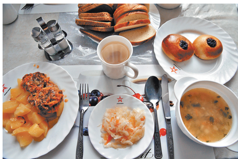
У гражданской истины «В здоровом теле — здоровый дух» есть армейско-флотская версия: «Как потопашь, так и полопашь». Обратите внимание на звезды на тарелках. Стильно!