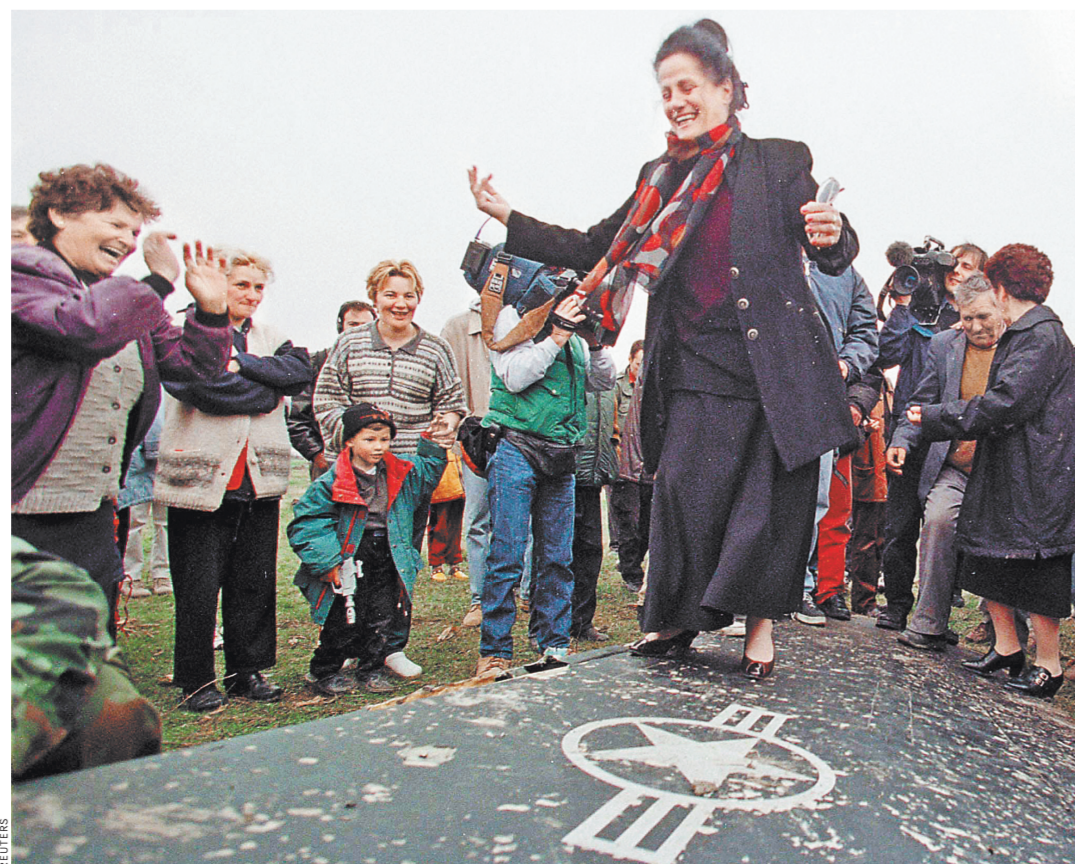
Сербская женщина танцует на обломках американского ударного самолета F-117, сбитого 27 марта 1999 года.

По его мнению, Сербия должна быть готова к тому, что приближается тяжелый период, когда возможны и другие силовые