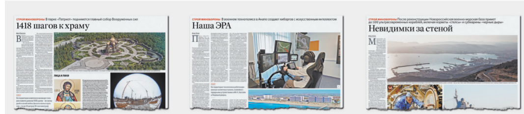
«РГ» продолжает публиковать фоторепортажи об уникальных военных строительных проектах под рубрикой «Строй минобороны». Предыдущие выпуски опубликованы в номерах «РГ» за 19.02.2019, 20.02.2019, 21.02.2019 и 22.02.2019. А также на нашем сайте: rg.ru/sujet/6149.