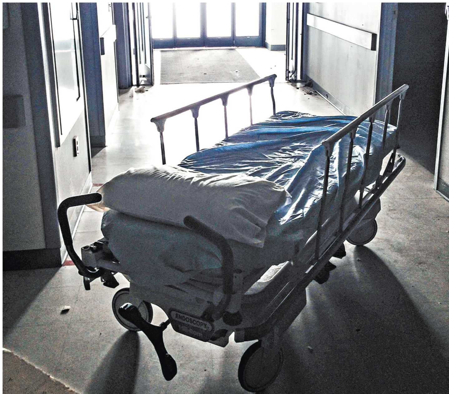
Материал «Сидеть, лежа на боку», вышел в №43 (7801) «Российской газеты» от 27 февраля 2019 года.

22 и 23 марта актеры МХТ играют в Зарайске, 5 и 6 апреля в Чехове, 17 и 18 мая в Серпухове, 24 и 25 мая в Дубне.