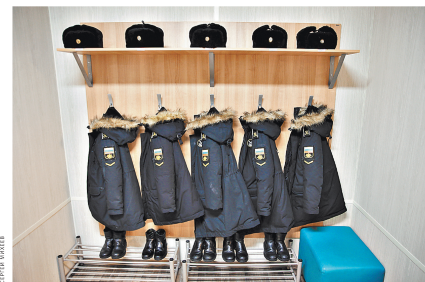
Формально каждый нахимовец — гражданский человек. Военным он может стать после того, как выпустится из училища. Но по духу и настрою эти ребята — будущее флота России.