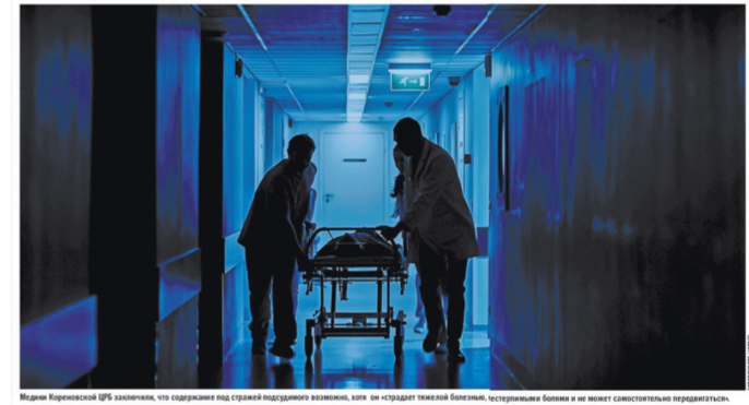
Материал «Сидеть, лежа на боку», вышел в №43 (7801) «Российской газеты» от 27 февраля 2019 года.