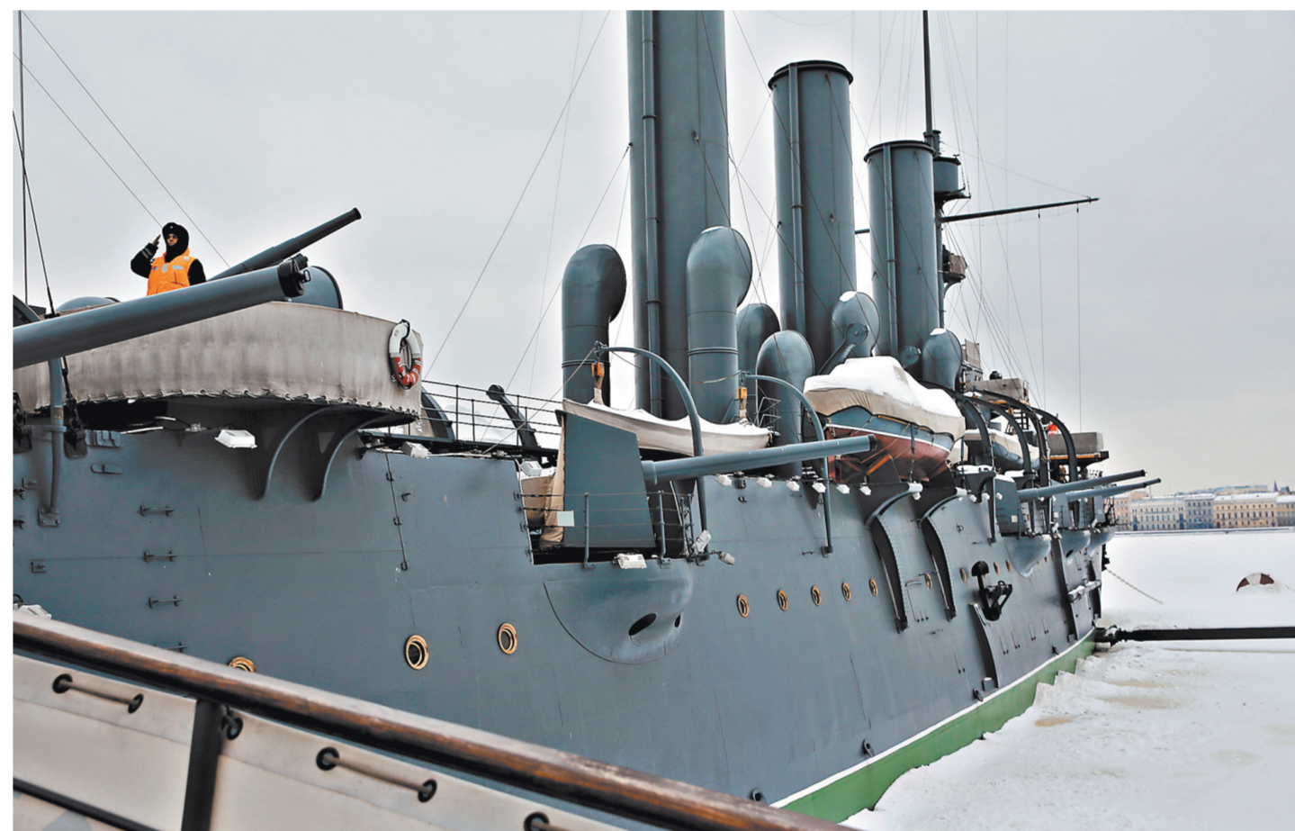
Нахимовское училище в Ленинграде открыли осенью 1944 года. Осенью 1948 года крейсер «Аврора» принял на борт первых воспитанников выпускной роты.