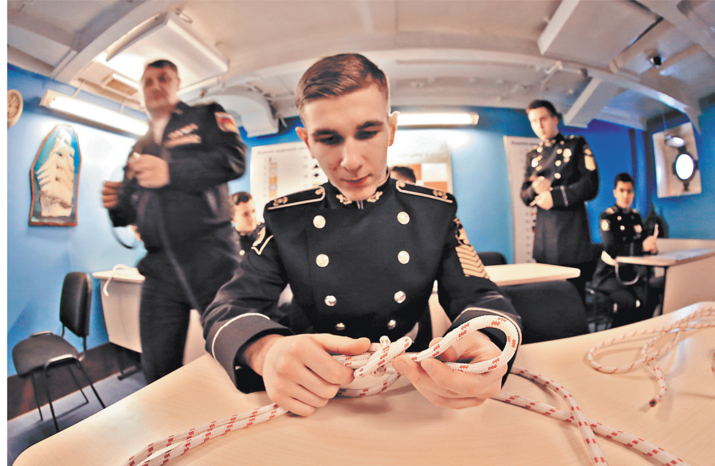
Знаете, чем коренной конец отличается от ходового? Между тем морские узлы — это искусство из истоков мореплавания. И любой нахимовец им владеет.