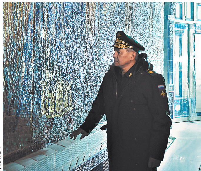
Сергей Шойгу подчеркивает, что все детали оформления Главного храма Вооруженных сил уникальны.

«Мы хотим, чтобы каждый шаг здесь запомнился, как