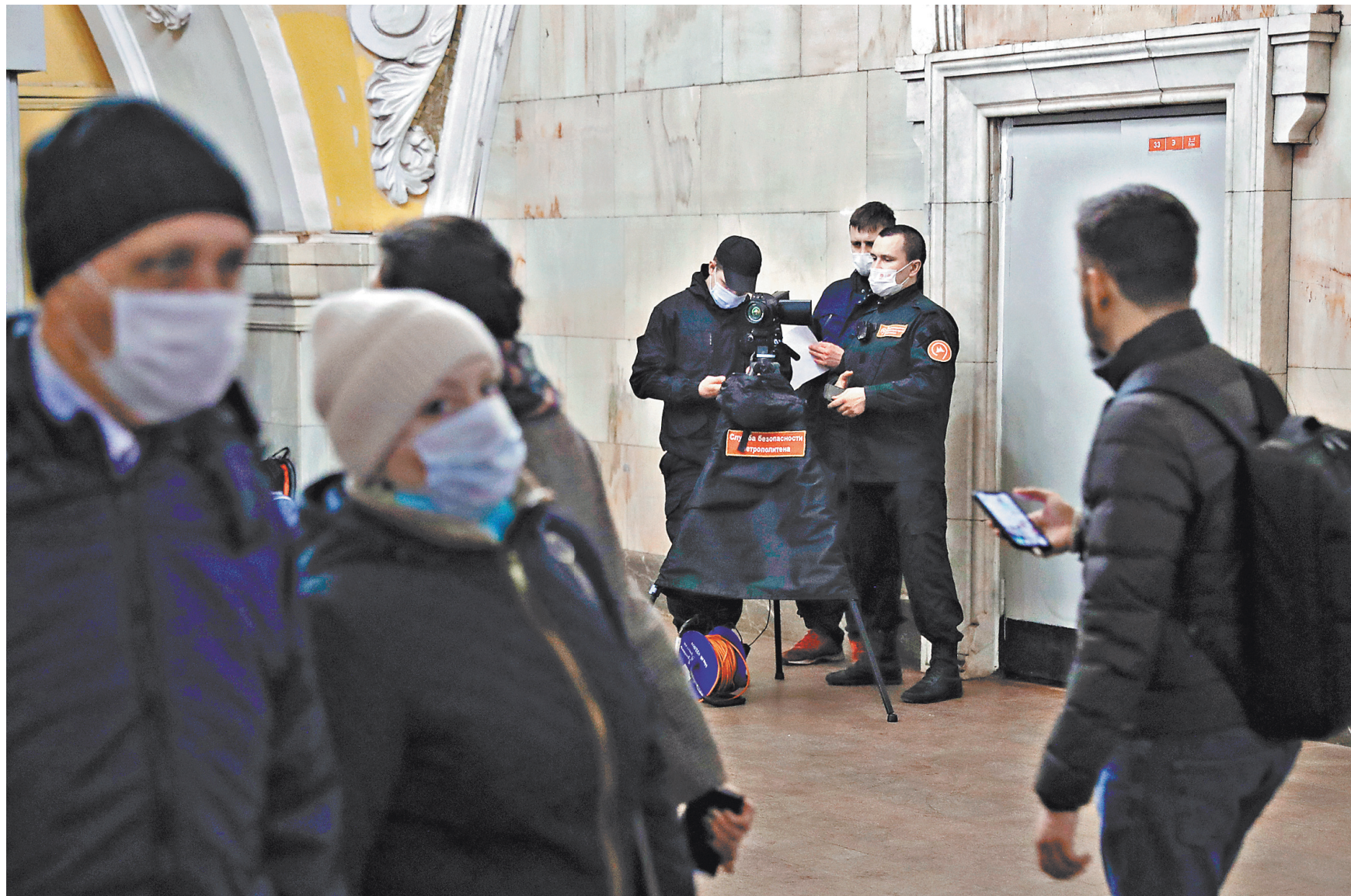
Московский метрополитен из-за коронавируса не прекратит работу. Но его сотрудники дополнительно закупили 14 тонн дезинфицирующих средств для обработки составов всех элементов инфраструктуры — поручней эскалаторов, турникетов, автоматов по продаже билетов. Обработку проводят каждые два часа, включая ночное время. На станциях с самым большим пассажиропотоком работают медики с тепловизорами.