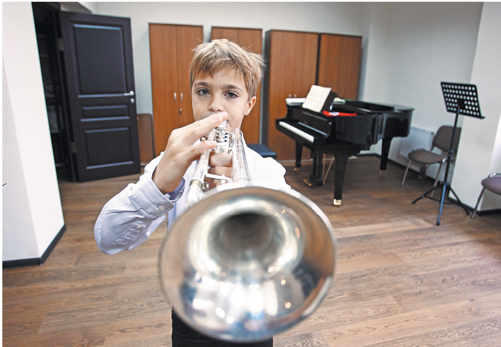
Российским школам искусств нужно почти 16 тысяч духовых инструментов.

Сроки поставок производителей нарушили. Минпромторг начислил пени на общую сумму 25,9 млн рублей, но взыскивать