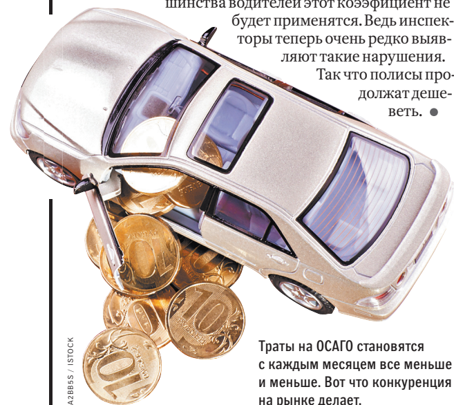
Траты на ОСАГО становятся с каждым месяцем все меньше и меньше. Вот что конкуренция на рынке делает.

Так что полисы продолжают дешеветь. Траты на ОСАГО становятся с каждым месяцем все меньше и меньше. Вот что конкуренция на рынке делает.