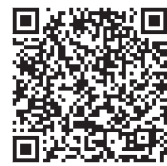
Список бесплатных онлайн-курсов для студентов.

— Исследование типологии трудностей будет показывать, где мы недорабатываем в составлении образовательных программ, — заключил эксперт. ●