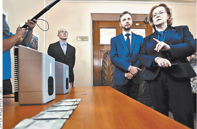
Вероника Скворцова, руководитель Федерального медико-биологического агентства: Разработка вакцины от коронавируса прошла первую фазу, испытания закончатся в июле, примерно через 11 месяцев препарат будет готов.

Компания «Аэроэкспресс» изучает возможность отмены утренних и вечерних рейсов из-за снижения пассажиропотока на фоне распространения коронавирусной инфекции. Также компания продлила до 31 декабря действие всех электронных билетов, купленных в период с 1 февраля 2020 года. При этом, если пассажиры приняли решение совсем отменить поездку, стоимость билетов будет возвращена им в полном объеме.