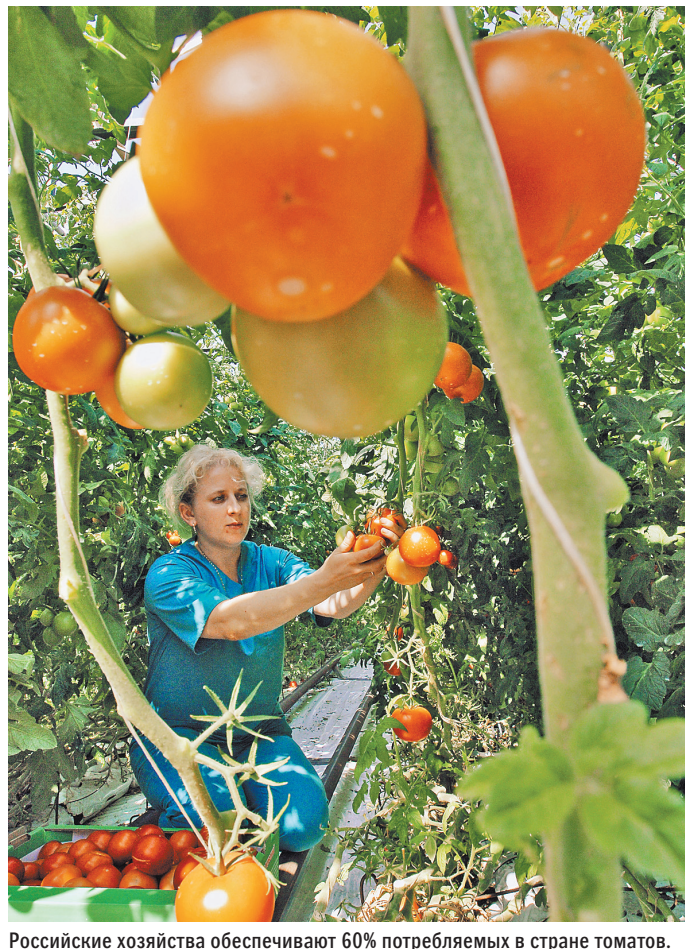
Российские хозяйства обеспечивают 60% потребляемых в стране томатов.

Производство тепличных овощей в последние годы стремительно растет. В прошлом году в зимних теплицах было выращено рекордные 1,14 млн т овощей — это выше среднего показателя за последние пять лет. По оценке ведомства, по