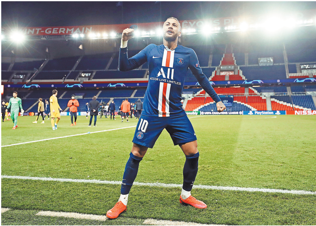
Неймар сообщил руководству «ПСЖ», что намерен вернуться в «Барселону».

Бразилец уверен: этим летом он вернется на «Камп Ноу». Он уже отказался вести переговоры с «ПСЖ» о продлении соглашения и сообщил боссам французского клуба о намерении перейти в «Барселону». Сообщается, что Неймар готов даже на ультиматум, лишь бы осуществить свою мечту.