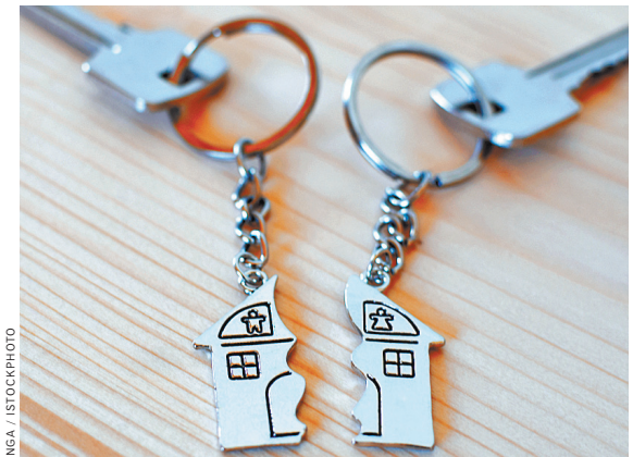
Раздел имущества при разводе должен происходить с учетом интересов детей. Поэтому поровну не всегда получается.

С таким решением бывшая жена не согласилась. Женщина оспротестовала его в Смоленском областном суде, где ее доводы были услышаны. Апелляция пришла к выводу, что в этом споре даме причитается все же две трети нажитого имущества. В обоснование подобного вывода областные судьи сослались на наличие «личных» неприязненных отношений между сторонами и необходимость отступить от принципа равенства долей супругов в общем имуществе ради интересов детей.