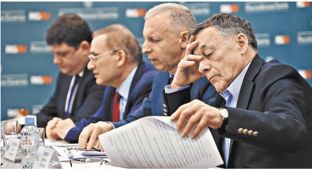
По мнению ученых, главная задача нацпроектов в том, чтобы люди реально ощутили улучшение уровня жизни.

Леонид Гохберг: Главные барьеры — это состояние конкурентной среды и сложившийся инвестиционный климат. Сейчас большинство компаний работают на неконкурентных рынках. Либо они монополисты на национальном уровне, это касается, в том числе, крупных госкомпаний. Либо они не сталкиваются с конкуренцией на локальных рынках. ●